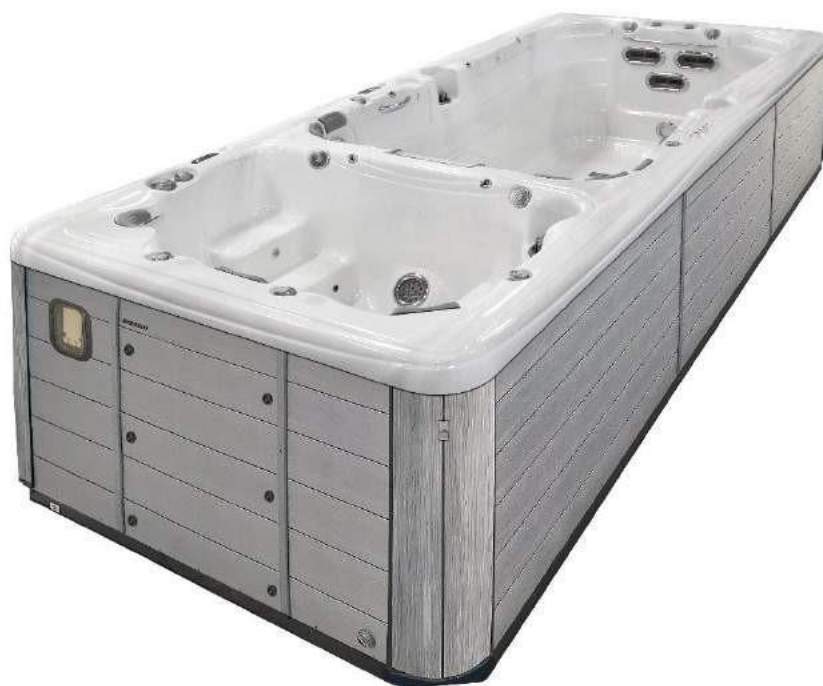
Modèle de jupe présente sur AQUEX 19 ( idem pour AQUEX 13 et 17)